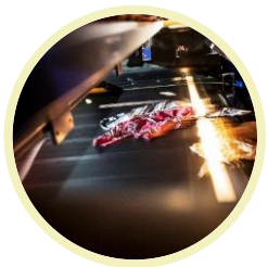
Cirkulär textil Sundsvall/Mörrum/ Malmö