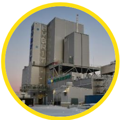
Fossilfritt järn och stål Norrbotten