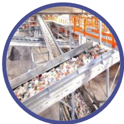
Cirkulär plast Motala/Stenungsund