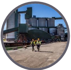
Klimatneutral cement Slite